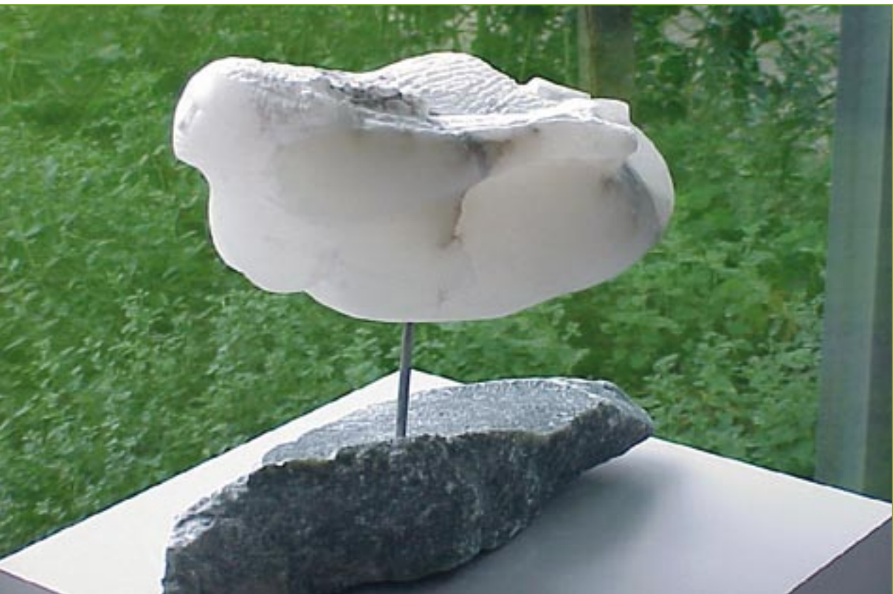
Beeldje: Op vleugels naar huis