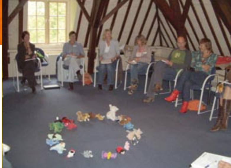
Trainingssessie: 'Ook knuffels spelen een rol'.