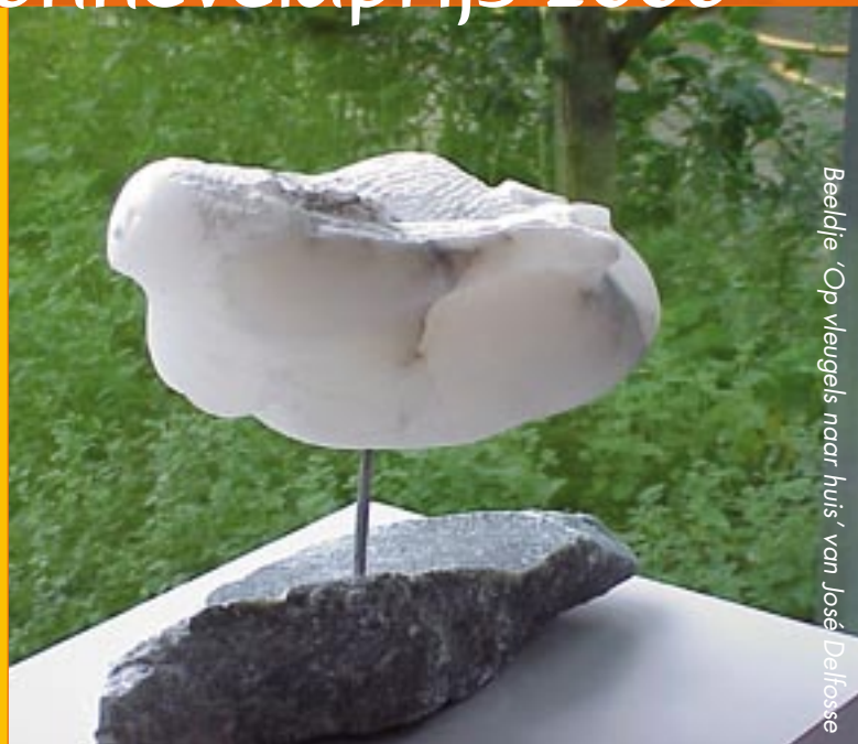
Beeldje 'Op vleugels naar huis' van José Delfosse

Het door de jury te beoordelen materiaal kan tot uiterlijk 1 maart 2008 digitaal worden ingezonden naar hvo@hvo.nl . Leraren kunnen met motivering ook door derden voorgedragen worden. De jury zal bestaan uit drie door de Stichting HVO aan te wijzen deskundigen.