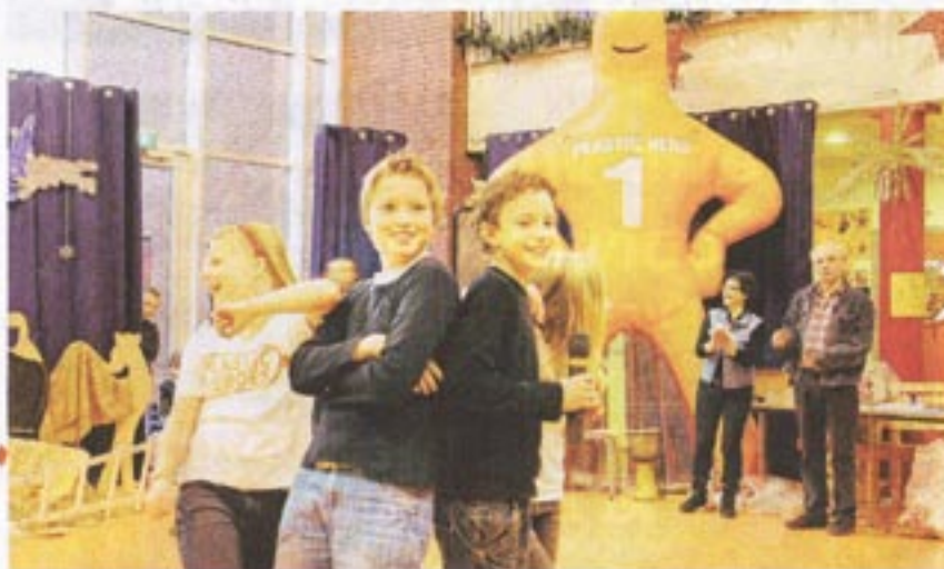
Leerlingen van OBS Jan Ligthart hadden de lessen over het vele kunststof die wij dagelijks weggooien vertaald naar een 'plasticberg' die werd tentoongesteld.